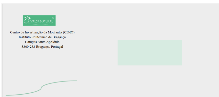
Figura 2. Modelo de envelope do projeto ValorNatural.