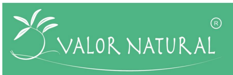
Figura 1. Logotipo do projeto ValorNatural.

A identidade corporativa (marca) do projeto ValorNatural foi desenvolvida pelos serviços do IPB (Figura 1), bem como o estacionário: modelo de envelope (Figura 2) e modelo de ofício (Figura 3).