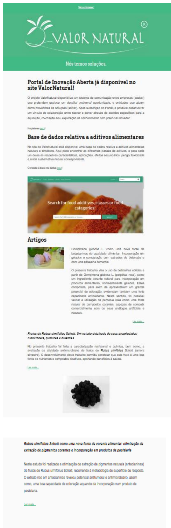
Imagem 6. Newsletter mês de fevereiro de 2020.