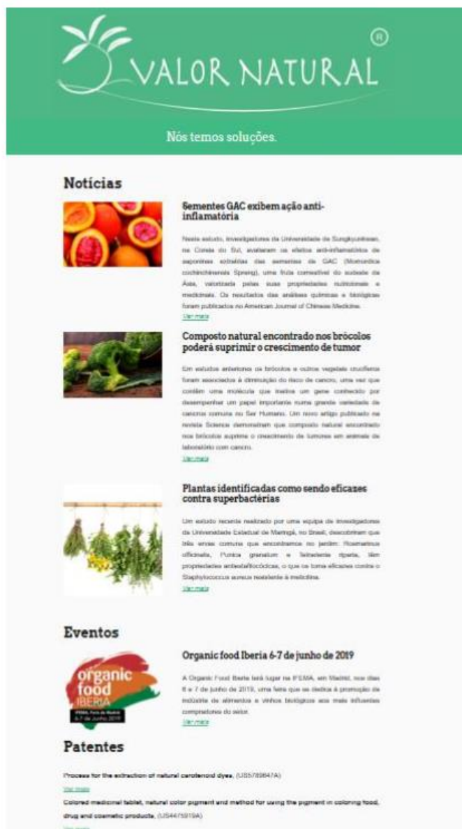
Imagem 3. Newsletter mês de maio de 2019.

No terceiro semestre de execução do projeto foram publicadas três edições da Newsletter : mês de setembro de 2019 (Imagem 4), mês de novembro de 2019 (Imagem 5) e mês de fevereiro de 2020 (Imagem 6).