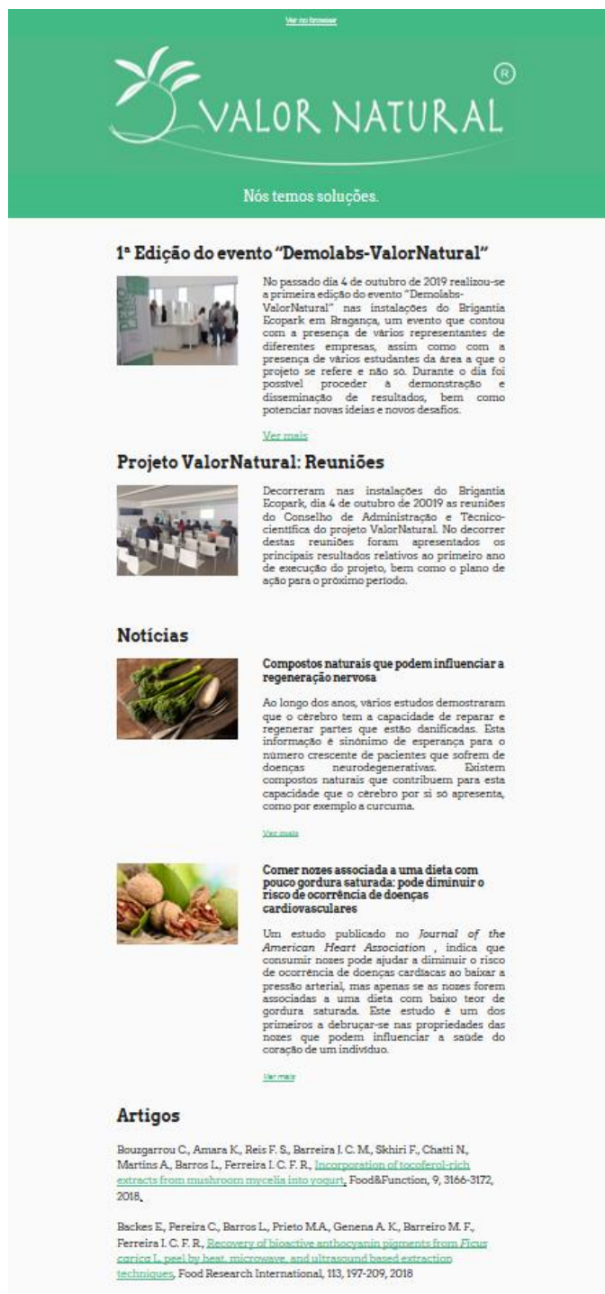
Imagem 5. Newsletter mês de novembro de 2019.