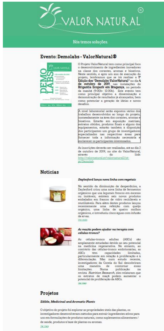
Imagem 4. Newsletter mês de setembro de 2019.